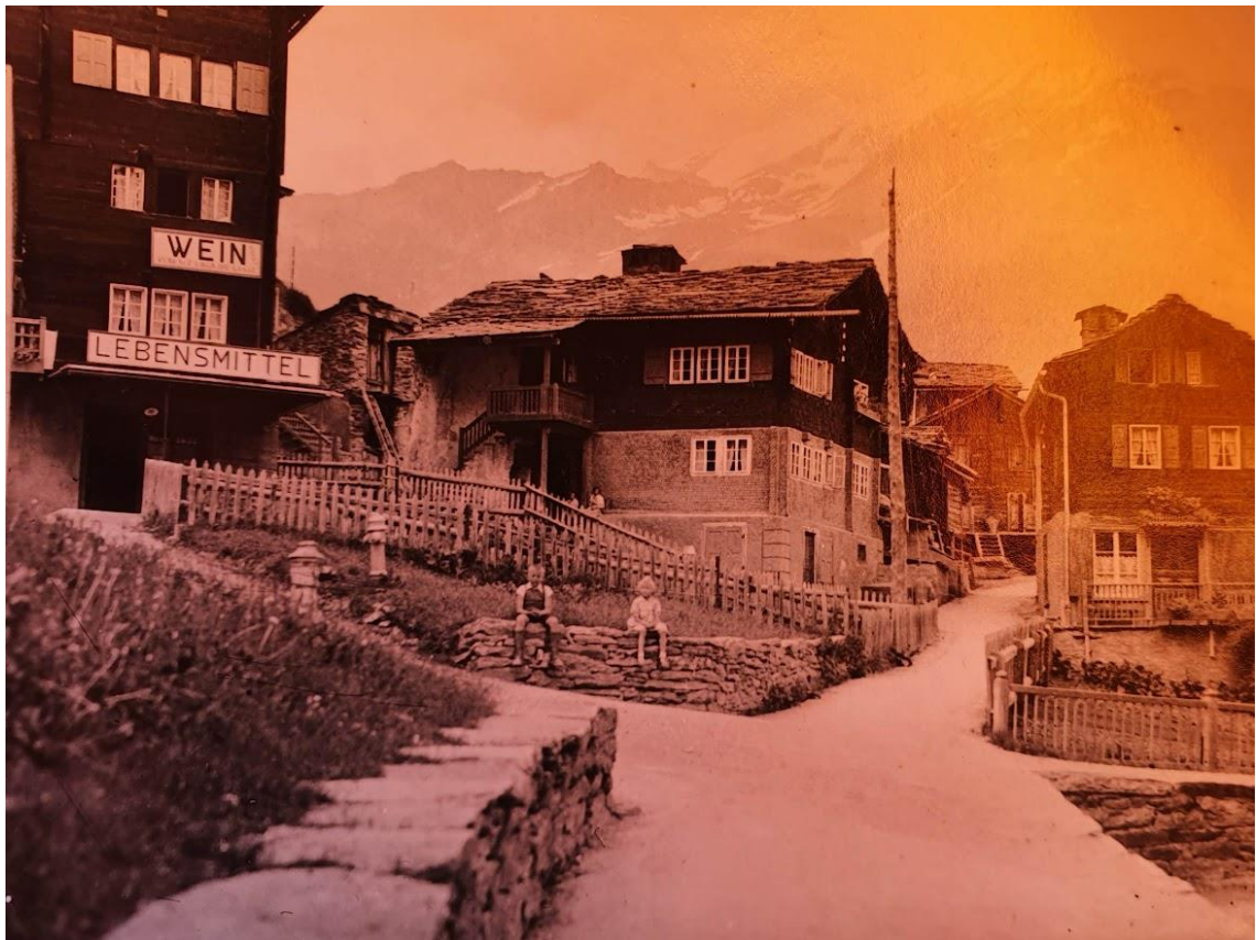
Vorne Wohnhaus (jetzt unten Fumoir), hinten «Schiir und Stall» (Restaurant Vieux Chalet)

In den Jahren 1972/73 wurde der alte Stall und die Scheune zum Restaurant Vieux Chalet umgebaut und 1973/74 eröffnet. Der damalige Besitzer war Imseng Adelbert.